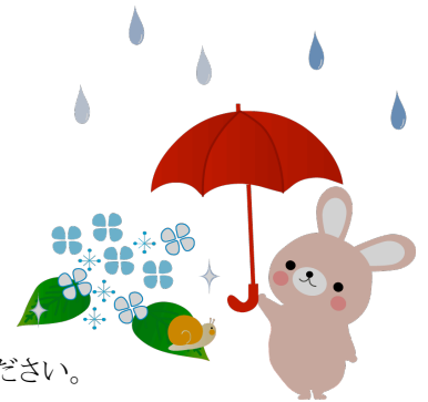
今月の在籍児数(6月1日現在)