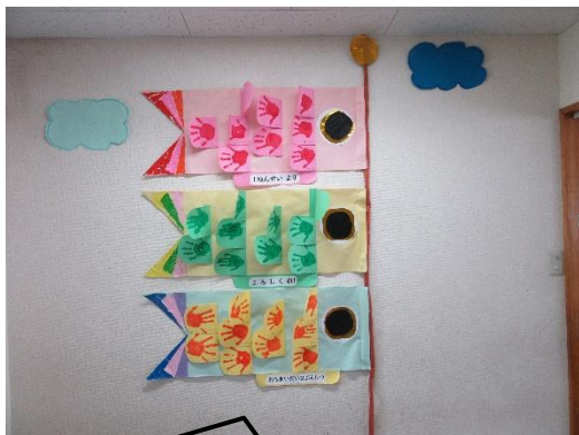
1年生のかわいい手形のこいのぼりをプレゼント！

初めて上級生と合同行事を行いました。当日、自己紹介で緊張しないよう練習を行うと「もう一回練習してもいいかな？」「家でも練習してくる！」とまじめな1年生。おかげで当日はちょっぴりドキドキしながらでしたが、はっきり言うことが出来ました。キャンディーレイのプレゼントの首にかけてもらおうと嬉しそうでした。1年生からのお礼は、みんなのかわいい手形のこいのぼりをプレゼントとしました。2、3年生が企画してくれた「ボール回しゲーム」は1年生から4年生までが楽しめるゲームで次々に増えていくボールを落とさないように頑張る次の人にパスしていました。おやつもみんなで、いただきました。総勢92人、笑顔いっぱいのお会となりました。