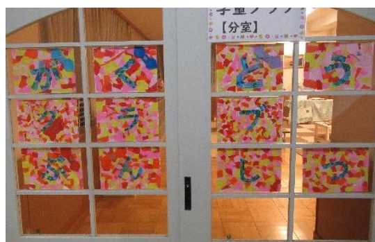
↑学童クラブ入り口

工作や折り紙の得意が得意な子どもたちなので、ランチルームの看板をちぎり絵で作成しました。外遊びタイムは、ドッチボールと大縄が人気です。最近では、ミニゴールでのサッカーを始めました。例年ですと上級生が教えてくれたり、見様見真似でトライしてみるという1年生の姿でしたが、今年はそのお手本がいません…。しかし、1年生だけにしっかりとルールが伝えられるという利点もあるので丁寧に教えていきたいと思っています。