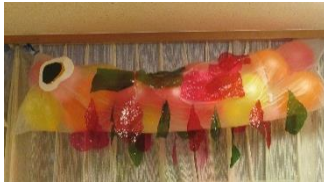
風船を使って、こいのぼりを作りました。

=お知らせ= 当日の育成は、 受け入れ→分室 お迎え→落合第二学童クラブ になります。昼食後移動しま す。